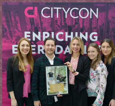
”Vi inleder samarbete med Citycon.”