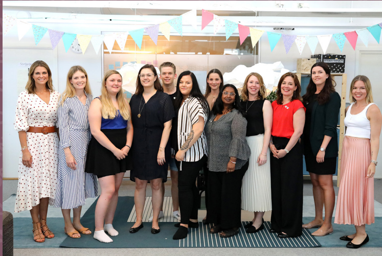
”Prinsessan Madeleine hälsar på i verksamheten i Stockholm.”