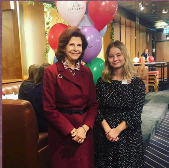
”Vi firar drottningens organisation Childhood foundations 20-års dag.”