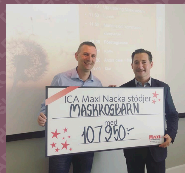
”Ica maxi Nacka har samlat in pengar till oss genom däckbyte.”